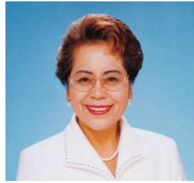
せこゆきこ元衆議院議員 比例東海予定候補・愛知4区重複