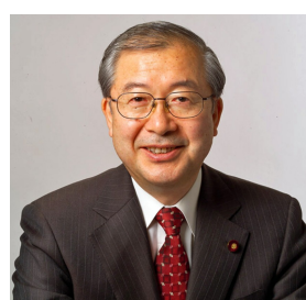
佐々木憲昭衆議院議員 比例東海予定候補