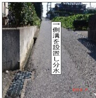
←側溝を設置し分水