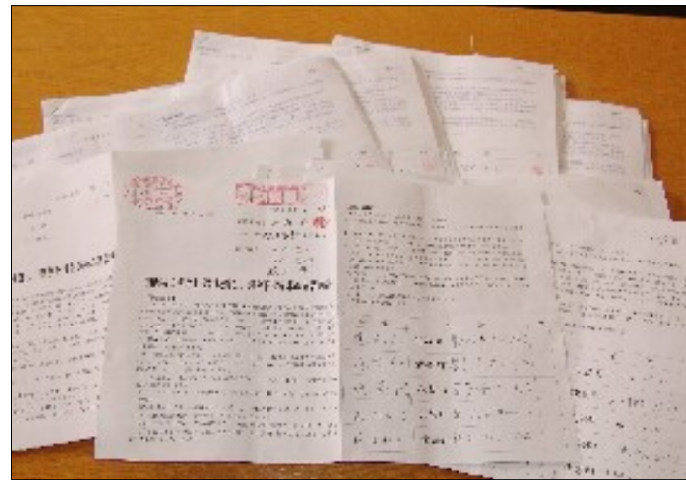
12月議会に提出された請願書

政和クラブや公明党も一般質問や討論で国保税の引き上げ問題をとり上げましたが、いずれも「財政逼迫」の折、致し方ないという姿勢に終始し、結局、日本共産党以外の会派議員は国保税の引き上げに賛成しました。 今回の国保税引き上げを食い止めることはできませんでしたが、暮らしや福祉を守るために、今後とも全力を挙げる決意です。